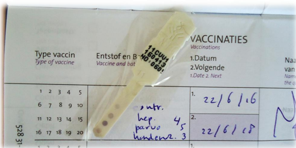
Foto 1: Titerstaaltje van een hond van 8 jaar. Zij was twee jaar daarvoor voor het laatst gevaccineerd, een jaar geleden was er voor het eerst een titerbepaling gedaan die uitwees dat vaccinatie niet nodig was. De onderste drie stippen zijn significant donkerder dan de bovenste stip, de controlestip. Deze hond beschikt dus over een ruime hoeveelheid antilichamen tegen hepatitis, parvo en distemper/hondenziekte. Met deze waarden zou het zinloos zijn om de hond te vaccineren, en op basis van deze uitslag en de ervaring van de dierenarts is deze hond voor twee jaar vrijgegeven. Dat betekent dat twee jaar na deze titerbepaling gekeken zou moeten worden of vaccinatie tegen die tijd zinvol is.

Bij vaccineren op maat wordt gewerkt met een zogenaamde titerbepaling. Er wordt bij de hond een klein beetje bloed afgenomen, en vervolgens wordt er gecheckt in hoeverre de hond beschikt over antilichamen tegen distemper, hepatitis en parvo. Dit zijn de drie vaccins die in de DHP-cocktail zitten. De hoeveelheid antilichamen wordt weergegeven op een stripje met vier stippen. De bovenste is de controlestip, de stippen er onder geven hepatitis, parvo en distemper weer. Wanneer de titerbepaling aantoont dat de hoeveelheid antilichamen hoog genoeg is, dan is vaccineren niet zinvol. De vaccinatie slaat dan simpelweg niet aan. Door middel van titerbepalingen kun je zien of het nut heeft om te vaccineren, bij simpelweg vaccineren kun je alleen maar gokken of hopen dat het nut heeft om te vaccineren. Titeren heeft dus voordelen, want meten = weten.